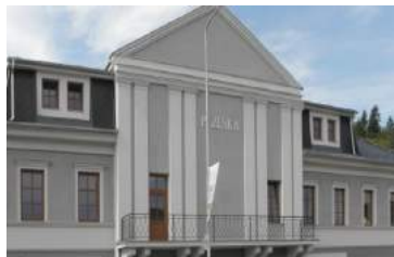
Kulturní dům Plzeňka, Beroun