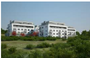
Panorama Kociánka I a II, Brno