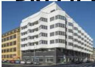
Polyfunkční bytový dům Drahojlova, Praha 9 Libeň