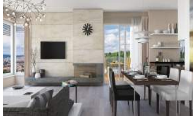
Bydlení pod Bílou horou - Bytový dům Juliana, Brno