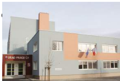
Úřad práce Klatovy