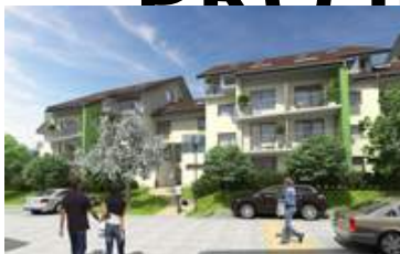
Rezidence Jabloňový sad, Moravany u Brna