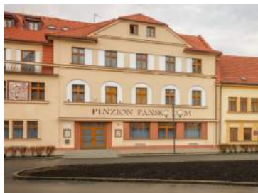
Penzion Panský Dům, Rožmitál pod Třemšínem