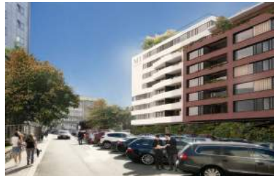
Rezidence Mezírka, Brno