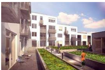
Bytový dům Metodějova, Brno - Královo Pole